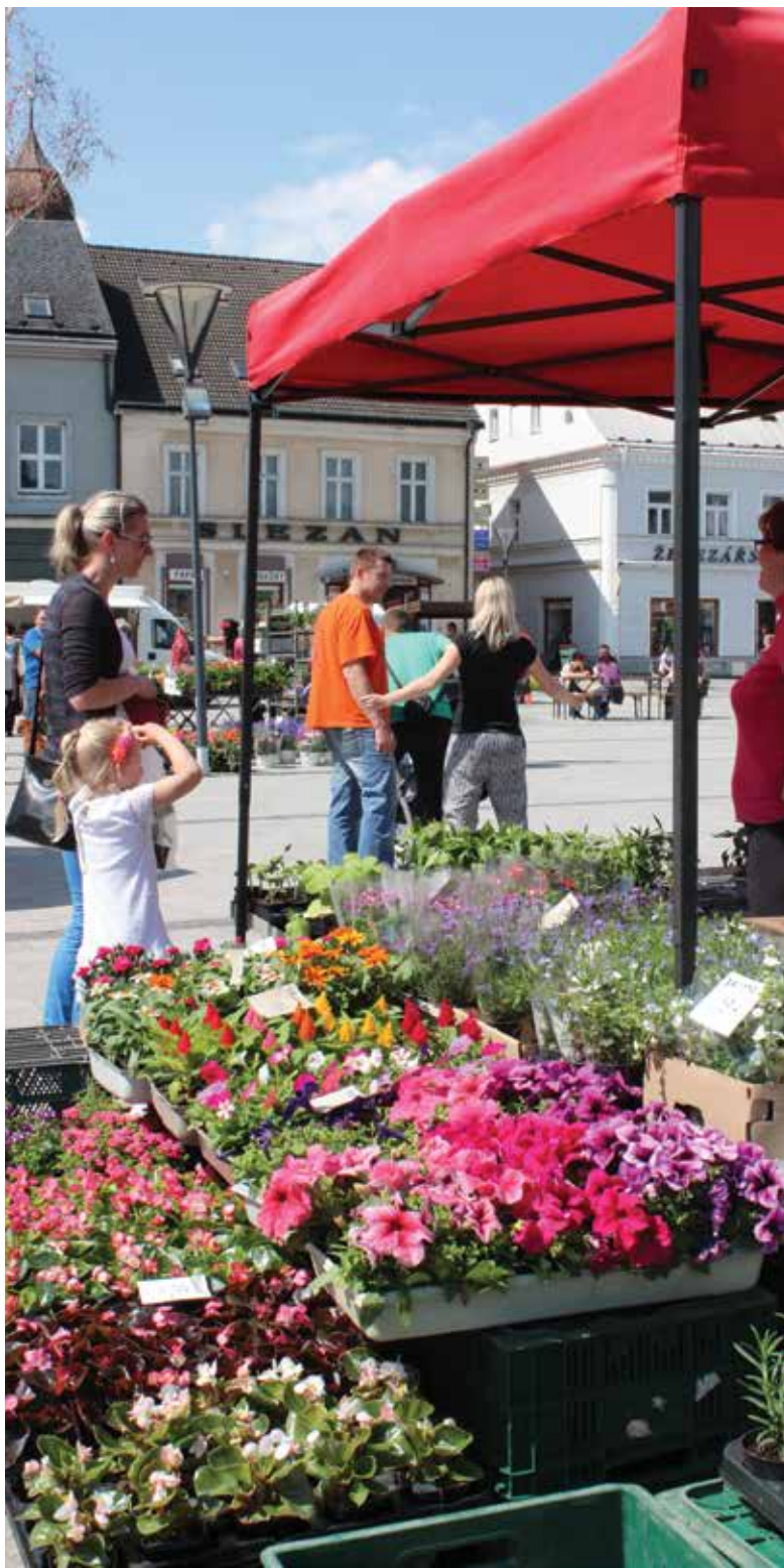
Posledním jarním farmářským trhům vládly barvy.