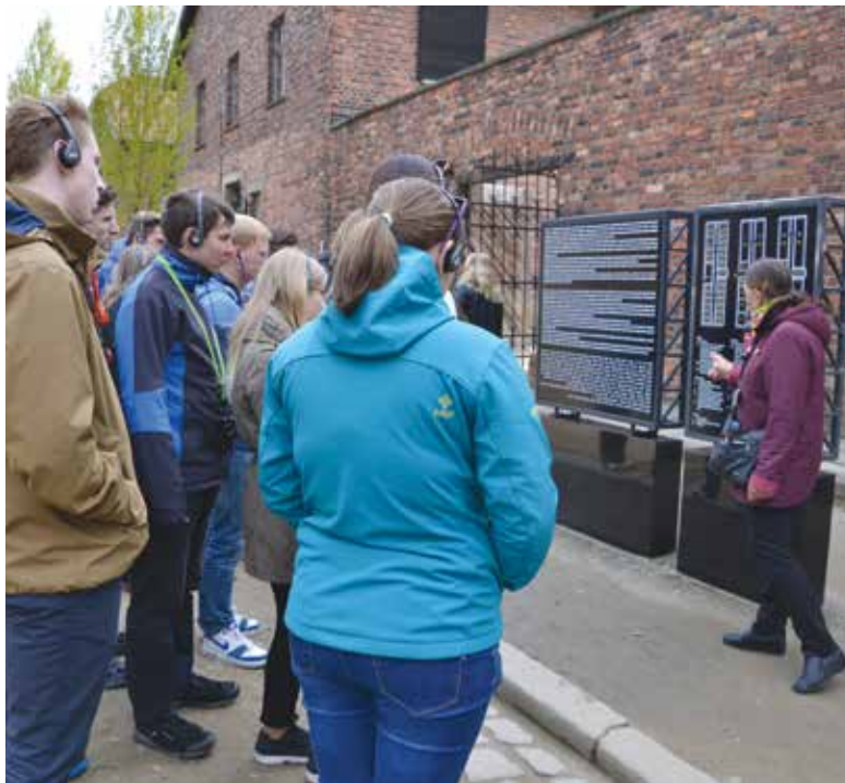
Studenti gymnázia při prohlídce koncentračního tábora Osvětim I.

Za touto bránou žádná svoboda nečeká. Trochu mě přejede mráz, když procházím prvních pár kroků ve stínu vysokého ostnatého plotu – jako kdybych slyšel zlověstně prskat elektřinu v dávno prázdných vodičích. Celou tuto děsivou scénérii ještě umocňuje výklad naší průvodkyně.