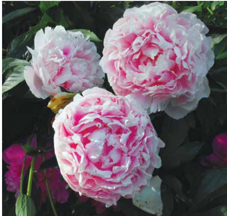
Pivoňky rostou na jednom místě po desetiletí.

Červen je také obdobím boje se mšicemi a houbovými chorobami.