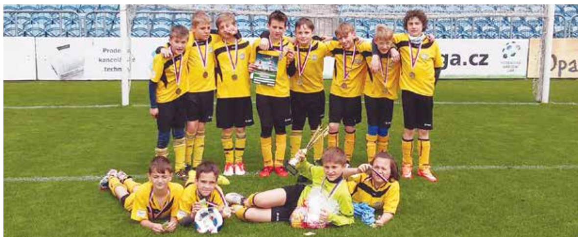
Fotbalisté z Tyršovky v okresním finále McDonald Cupu.