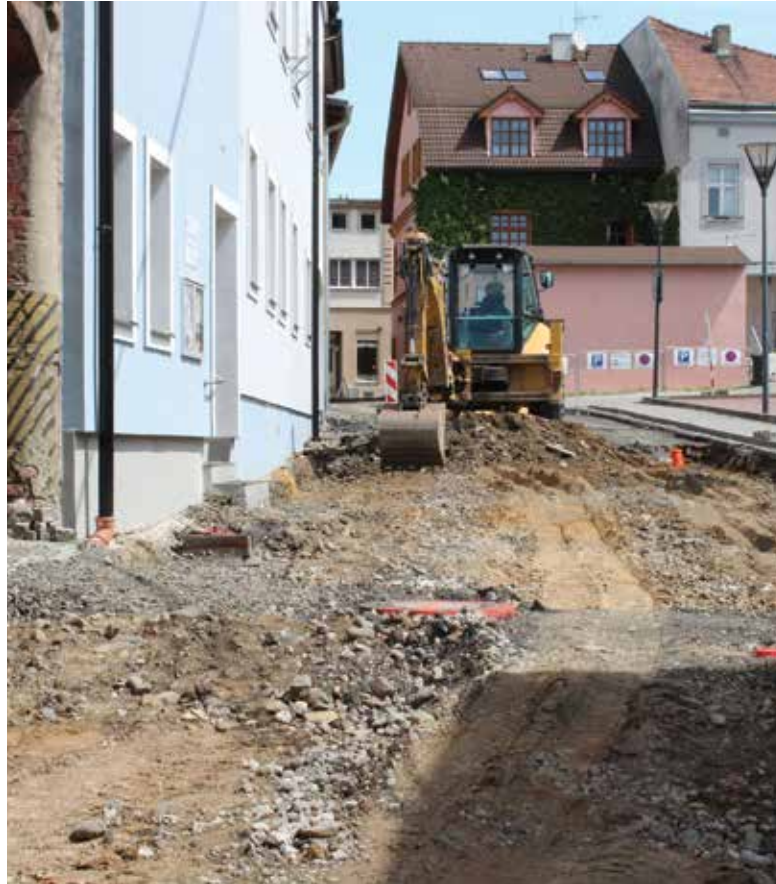
Po dobu opravy ulice U Bašty je uzavřen bezbariérový vchod do budovy A hlučínské radnice a přístup k bezbariérovému výtahu. Na vozíčku nebo s kočárkem musí návštěvníci aktuálně využívat vstup z budovy C.

V současnosti se opravuje také ulice Příkrá v Bobrovnících a buduje se parkoviště ve dvoře mezi bytovými domy Dr. E. Beneše 3,5 a Zahradní 12, 14. „Opravy komunikací v mnoha místech koordinujeme s firmou Vodovody a kanalizace Hlučín, která rekonstruuje vodovodní a kanalizační řády,“ doplnila