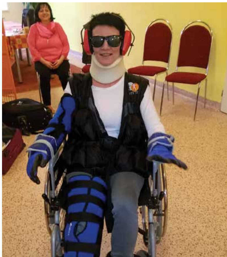
Se speciálními pomůckami zaměstnanci testovali, jak se cítí seniori.