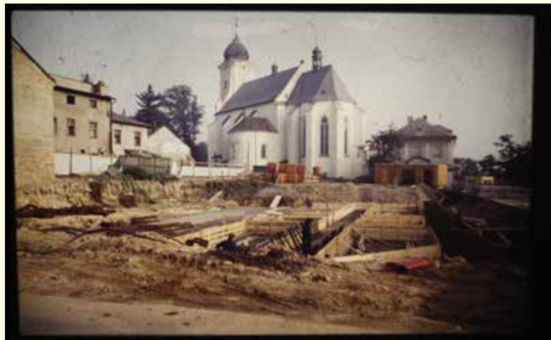
Neobvyklý pohled na kostel ještě před vznikem okolní zástavby.

Na myšlenkově a konceptuálně precizně ukotvené výstavě chce muzeum prezentovat nejen doposud neznámé fotografie, ale především ukázat, jak se město na některých místech proměnilo.