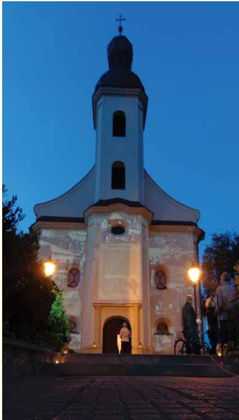
Loni byl noční o návštěvu kostelů zájem.