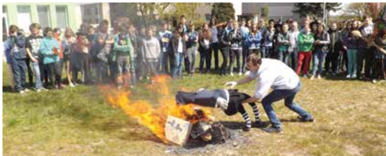
A zima je pryč i s čarodějnicemi.

Už tradiční pálení čarodějnic se na naší Základní škole Hornická konalo v příhodný termín 30. dubna. Ačkoli počasí během týdne bylo doslova aprílové, šikovní čarodějové a čarodějnice z páté třídy vykouzlili nejen modrou oblohu prosluněnou paprsky, ale postarali se i o veškerou organizaci. Děti z 1. až 4. tříd se zúčastnily zábavného dopoledne, které odstartovalo čarodějnickým průvodem. Na školním hřišti pak žáci postupně absolvovali deset zábavných stanovišť s hodem do černé díry, útekem čarodějnicí a obdobnými recesními disciplinami. Děti si vyzkoušely let na koštěti, jízdu na koloběžce, ale také určovaly různé druhy bylin, které jsou zapotřebí při míchání čarovných