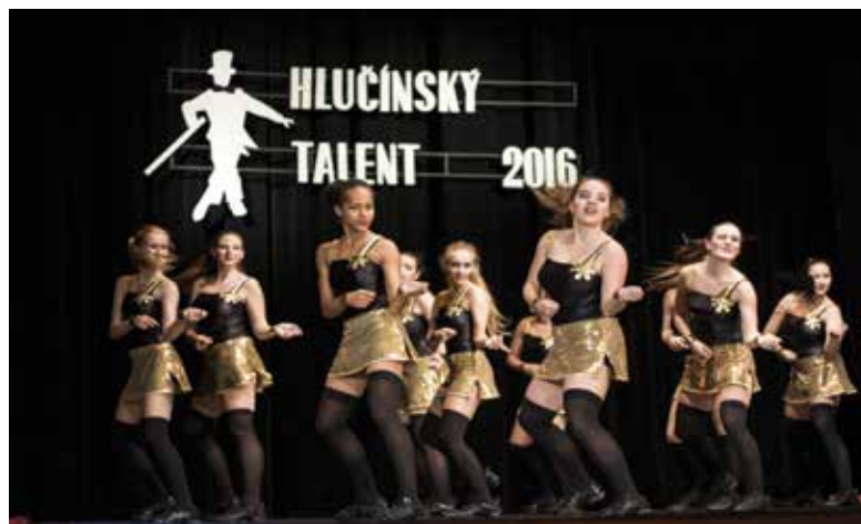
Soubor Ritmo z Rychvaldu si odvezl z Hlučinského talentu dvě druhá místa, dvě třetí místa a cenu za kostýmy k vystoupení Jako kdysi.